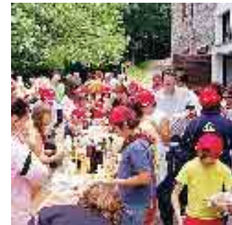
Una parte del gruppo che ha trascorso una settimana sui monti del Parmense

che doveva sembrare facile e breve, si è rivelata essere una lunga camminata a causa di un'indicazione sbagliata. L'ultimo giorno di vacanza estiva ha visto i ragazzi impegnati a rappresentare e interpretare uno degli episodi dell'avventura di Ulisse, che hanno poi messo in scena la sera stessa, vestendo