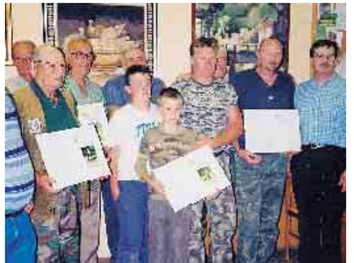
Il gruppo dei segugi premiati a Groppallo

FARINI - Iniziativa della sezione di Federcaccia