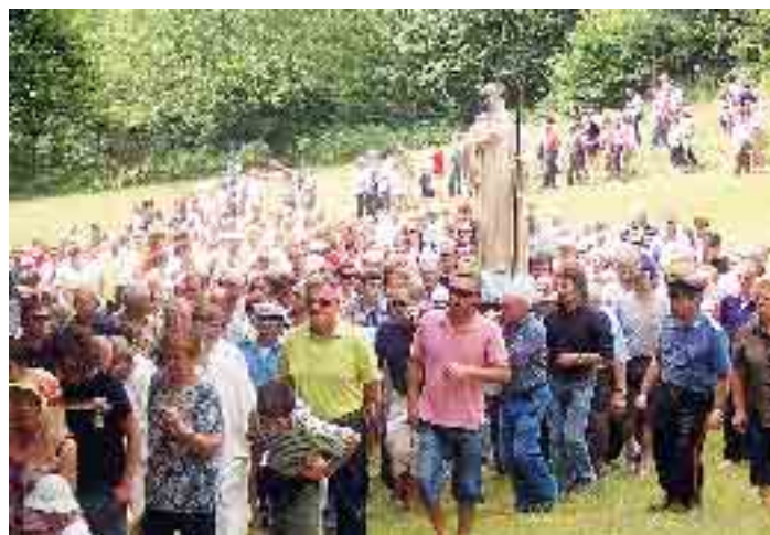
Un momento della processione con la statua di santa Franca portata a spalla