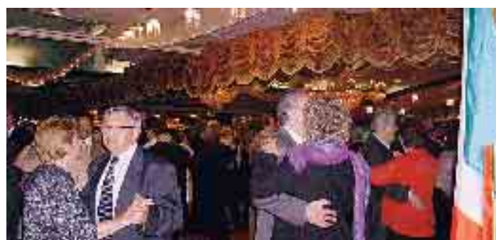
Danze all'Astoria World Manor sulle note dei brani più famosi del made in Italy