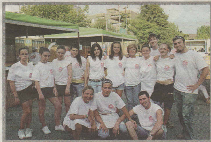
I giovani volontari che hanno servito ai tavoli alla festa del quartiere Molinetto (foto men.)

La prima delle tre serate di feste, allegria e buona cucina montanara è stata fissata per venerdì 17 luglio in compagnia della orchestra di "Ma-