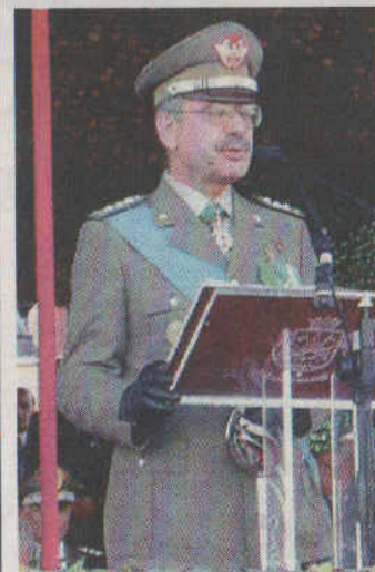
Il generale Fabrizio Castagnetti, capo di Stato maggiore dell'Esercito

LUGAGNANO - (f.l.) Il Comune di Lugagnano conferirà la cittadinanza onoraria ad un suo illustre ex cittadino: il capo di Stato maggiore dell'Esercito, generale di corpo d'armata Fabrizio Castagnetti. L'alto ufficiale, com'è noto, è di origini lugagnanesi (è nativo di Veleia Romana dove tuttora abitano i suoi familiari e dov'egli possiede un immobile) ma risiede obbligatoriamente a Roma per motivi di servizio. La cerimonia di conferimento della cittadinanza onoraria si svolgerà mercoledì 26 agosto, alle ore 18, nel corso di una apposita riunione straordinaria in seduta pubblica del consiglio comunale. La notizia ha destato soddisfazione nel territorio di Lugagnano. Il generale Castagnetti è capo di Stato maggiore dell'Esercito dal settembre 2007.