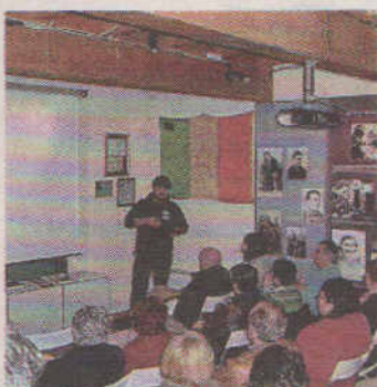
MORFASSO - Museo affollato durante le proiezioni. Mercoledì nuovo appuntamento